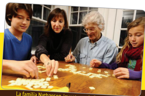
La familia Nathanson, inventores de BANANAGRAMS

Importado y Distribuido para España y Portugal por: Lúdilo S.L. C/Pouet de Nasio s/n, Parcela 5, Nave B2, Sector 14. 46190. Ribarroja del Turia, Valencia, Spain