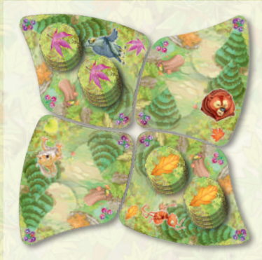
Partida de 2 jugadores con otras 2 ardillas dormilonas

En la Preparación, monta un tablero más por cada una. Baraja las fichas de cada dormilona y déjalas con las hojas bocarriba sobre los dos escondites de su tablero.