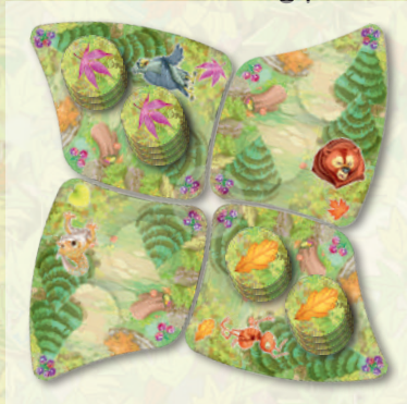
2 players game with 2 sleepyhead squirrels

During the set up, add an extra game board for every sleepyhead squirrel. Shuffle their tokens and place them on their leaf side in the two hiding places of their boards.